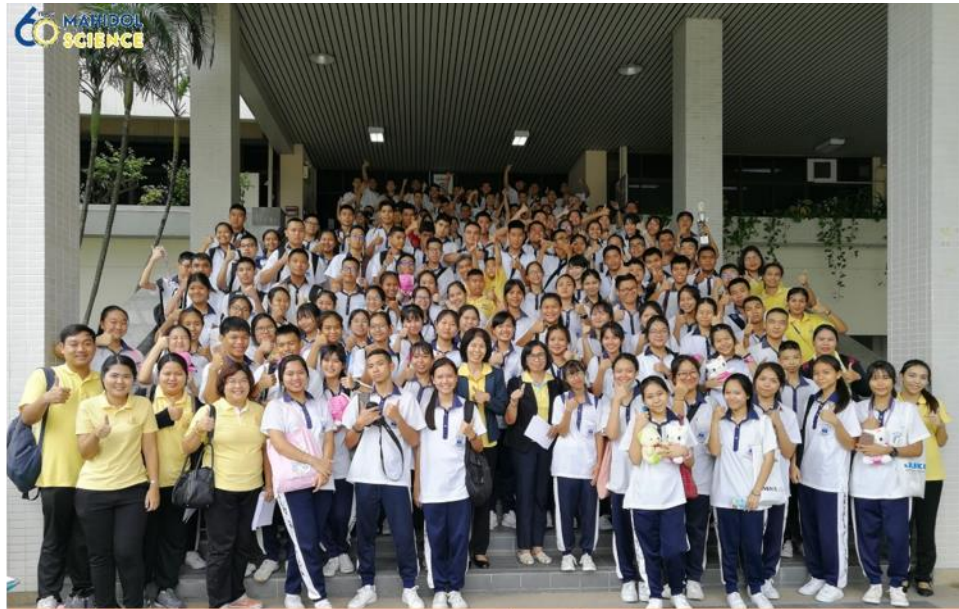
ค่าย STEM 1 DAY CAMP – ม.ปลาย โรงเรียนสารสาสน์พิทยาน คณะวิทยาศาสตร์ มหาวิทยาลัยมหิดล (ศาลายา)