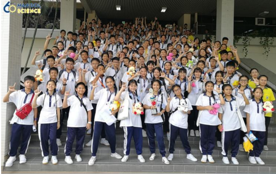
ถ่าย STEM 1 DAY CAMP – ม.ต้น โรงเรียนสารสาสน์พิทย ณ คณะวิทยาศาสตร์ มหาวิทยาลัยมหิดล (ศาลายา)