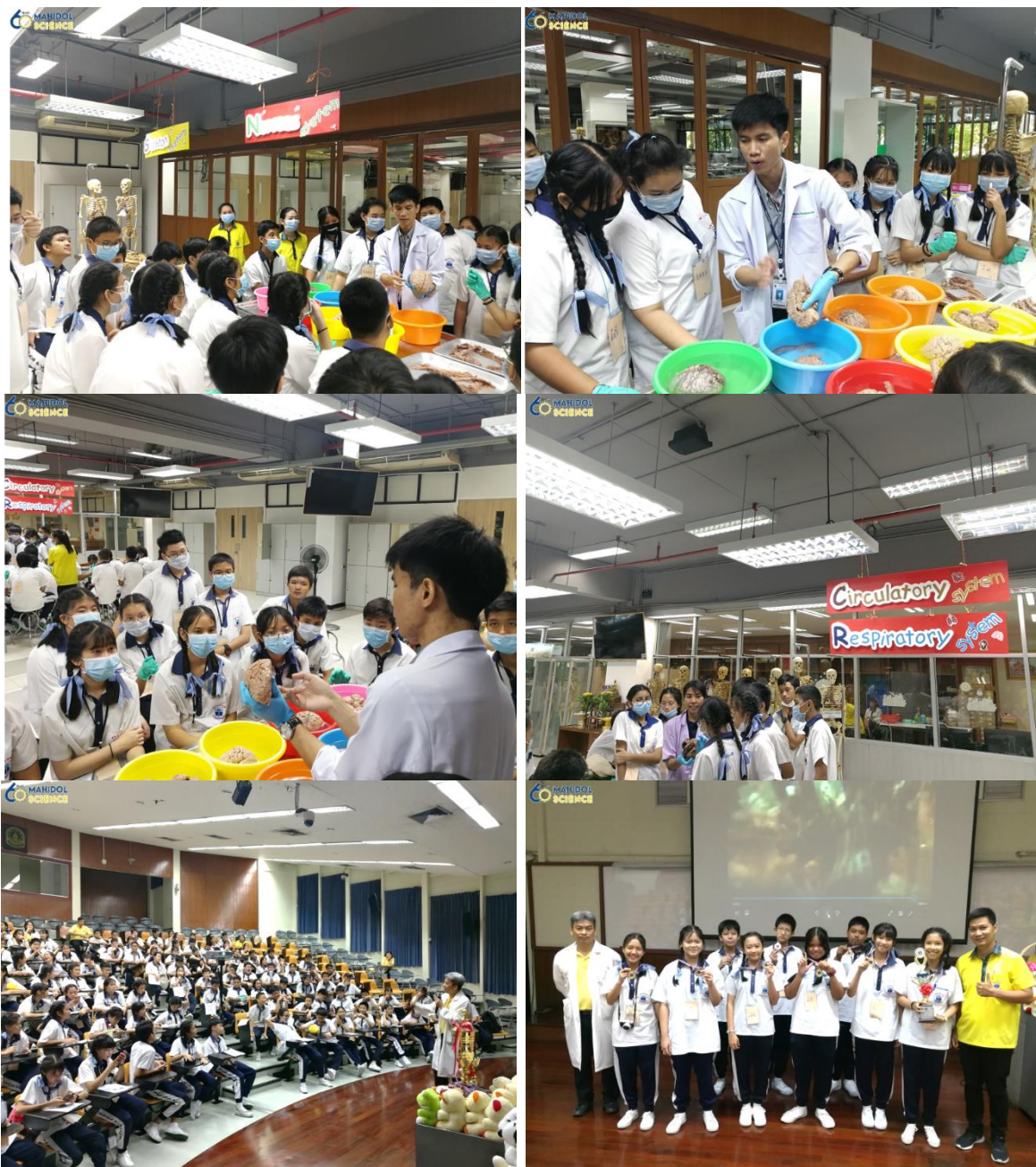
ภาพประกอบข่าว วันที่ 6 ก.ค. 62