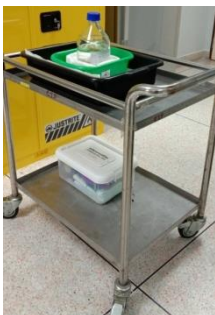
รถเข็นสำหรับเคลื่อนย้ายสารเคมี