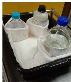
ภาชนะรองรับที่เป็นพลาสติก