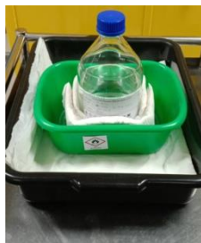
การเคลื่อนย้ายสารเคมี