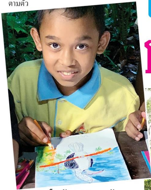
นกเงือกหัวหงอกของเกาชัด

สองสามปีที่ผ่านมามีข่าวคราวสะเทือนใจ คนรักป่ารักนกเงือกอยู่เป็นระยะ แต่ข่าวล่าสุดที่อยู่ในความสนใจของผู้คนคือข่าวการล่านกชนหินเอาโหนกตามใบสั่ง โหนกนกชนหินมีมูลค่าสูงกว่างาช้างหลายเท่า ยิ่งหายากก็ยิ่งเป็นที่ต้องการและราคาก็พุ่งขึ้นเป็นเงาตามตัว