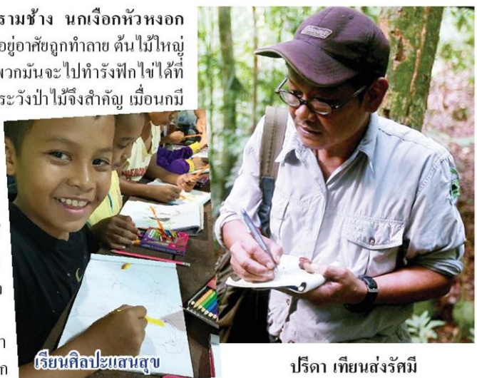
เรียนศิลปะแสนสุข