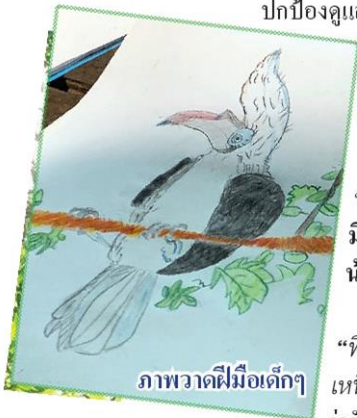
ภาพวาดฝีมือเด็ก ๆ

ปกป้องดูแลถิ่นที่อยู่อาศัยของนกเงือกเทือกเขาบูโดต่อไป