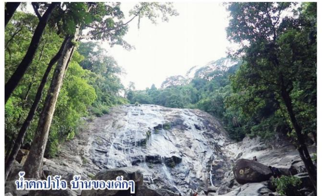
น้ำตกปาโจ บ้านของเด็ก ๆ

ส่วน ฟุรกอน มะลิมิง กำลังย่างเข้าวัยรุ่นตอนต้น เขารักนกเงือก บอกว่า “ชอบนกเงือกหัวแรดที่สุด เพราะสีสวยและหายาก” เด็กๆ ค่อยๆ ซึมซับความเป็นนักอนุรักษ์ แนวทางทำงานเพื่อนกเงือก