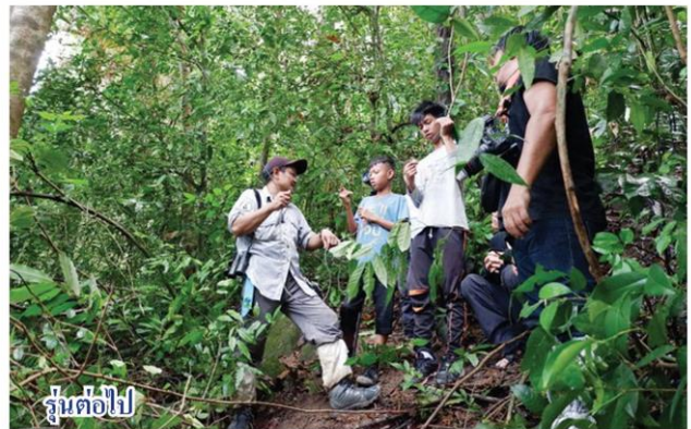
รุ่นต่อไป

ในขณะที่จำนวนประชากรนกชนหินที่เทือกเขาบูโดก็มีอยู่น้อยมากไม่ถึง 20 คู่ เป็นการดีหากมีการประกาศให้นักชนหินเป็นสัตว์ป่าสงวนโดยเร็วก่อนที่จะไม่มีนกชนหินให้อนุรักษ์ ในปัจจุบันนกชนหินอยู่ในภาวะวิกฤตเสี่ยงต่อการสูญพันธุ์เป็นอย่างมาก ทั้งจากการล่าและที่สำคัญการทำลายถิ่นที่อยู่อาศัยของพวกมัน