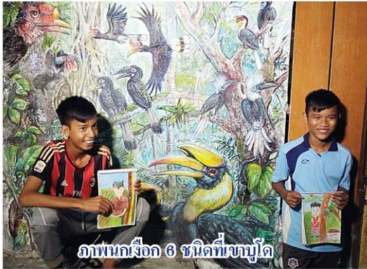
ภาพนกเงือก 6 ชนิดที่บูโด

คอลัมน์: สดจากเยาวชน: เด็กคือความหวังหัวใจแห่ง 'บูโด'