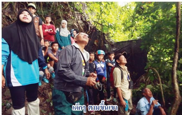
เด็กๆ ตามจิ้งเบง