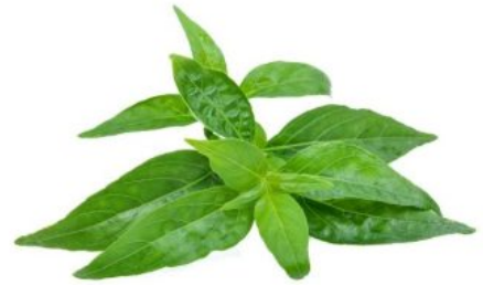
ฟ้าทะลายโจร

มีการแชร์กันว่า การนำกระชายมาสกัดร้อน สกัดเย็น จะทำให้ไม่ป่วยจากโควิด-19 ไม่ว่าจะเดินทางไปไหนที่ไหนตาม เรื่องนี้เป็นอย่างไร?