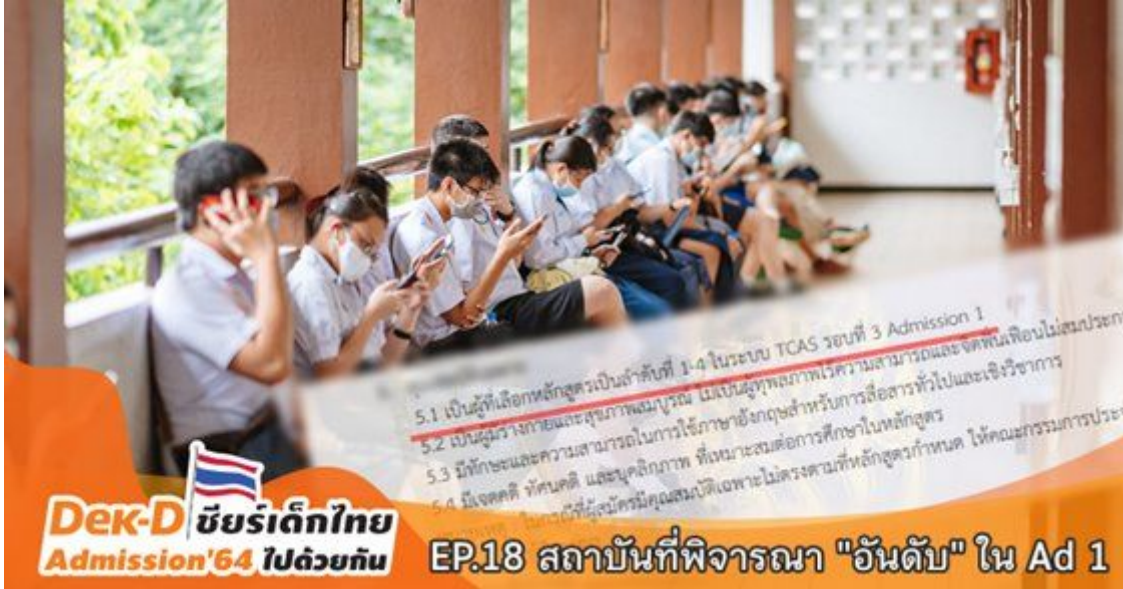
EP.18 รวมสถาบันที่พิจารณาอันดับในเกณฑ์ Admission 1

ซึ่งเกณฑ์นี้มหาวิทยาลัยเป็นผู้กำหนดรายละเอียดจะทำให้บางมหาวิทยาลัย มีการกำหนดคุณสมบัติเรื่อง "อันดับ" เข้ามาด้วย รายละเอียดจะเป็นอย่างไร ไปดูกันค่ะ