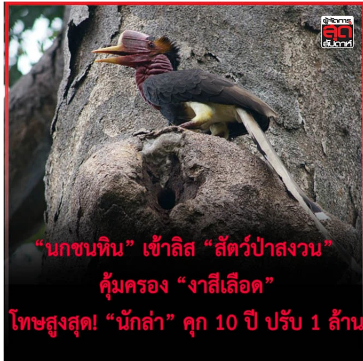
นกชนหิน ขึ้นทะเบียน สัตว์ป่าสงวน ลำดับที่ 20 ของประเทศไทย

“นกชนหิน” เข้าลิส “สัตว์ป่าสงวน” คู่ครอง “งาสีเลือด” โทษสูงสุด! “นักร้อง” คุก 10 ปี ปรับ 1 ล้าน เผยแพร่: 13 มี.ค. 2564 06:38 ปรับปรุง: 13 มี.ค. 2564 06:38 โดย ผู้จัดการออนไลน์