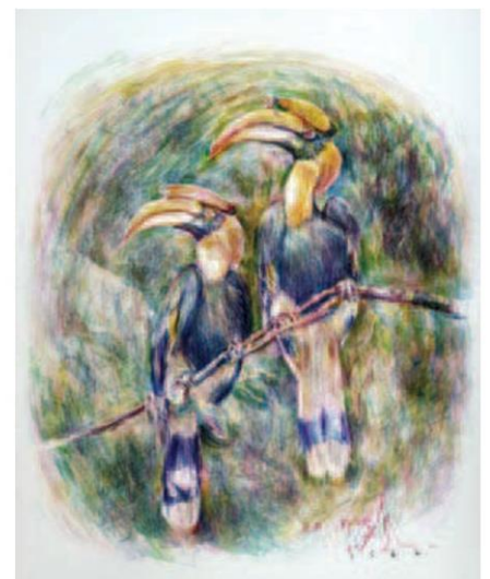
ภาพต้นแบบ ผลงาน เป็ สีสี่

ปีนี้ เวทีเสวนาวันรักนกเงือกในคอนเซ็ปต์ ปันรัก...ให้นักเงือก จึงประกอบด้วยคนรักนกเงือกหลากหลายสาขาอาชีพ มาให้ข้อมูลและบอกเล่าประสบการณ์ของมนุษย์ที่มี “รักแท้” ต่อนกเงือก