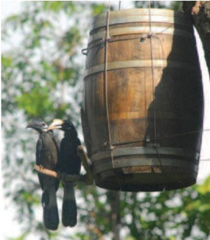
รักนกเงือกทำจากถังไม้โอ๊ค