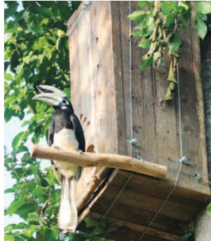
รักนกเงือกทำจากไม้ที่ซีกส์เซนส์ ยาวน้อย