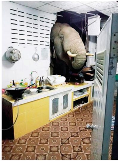
ภาพหลายบุญช่วย

อย่างที่บอกไปตอนต้น มีพืชหลายอย่างก็ช้างไม่ชอบ และที่สำคัญ จมูกช้างค่อนข้างไว ทีมวิจัยก็เลยเกิดไอเดีย “น้ำหอมที่ไล่ช้าง (smelly elephant repellent)” ขึ้นมา พวกเขาคิดค้นน้ำยาสูตรพิเศษขึ้นมา เป็นน้ำยาที่ส่งกลิ่นฉุนได้ใจ จนถึงขนาดช้างยังทนไม่ไหว ต้องเอางวงอุดปาก อพยพหนีกัน