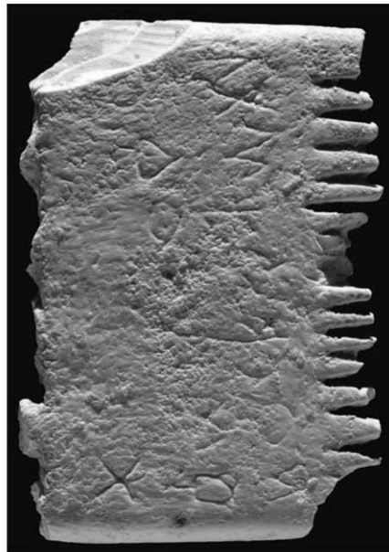
ภาพหวีงาช้างจากดินแดนแห่งพันธสัญญา

เธอเริ่มตั้งสมมุติฐาน "บางที มันก็อาจจะเป็นหวีเล็กๆ ที่พ่อแม่สั่งทำขึ้นมาให้พวกเด็กๆ ก็ได้" แต่คำถามคือตัวอักษรบนหวีนั้นเขียนว่าอะไร