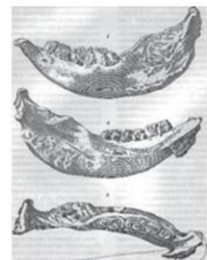
ภาพวาดขากรรไกรล่างแห่งมอสโก (Moscow mandible)