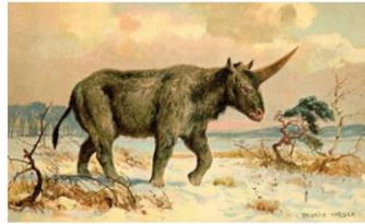
ภาพวาดยูนิคอร์นแห่งไซบีเรีย โดยไฮน์ริช ฮาร์เตอร์ (Heinrich Harder) ปี 1920