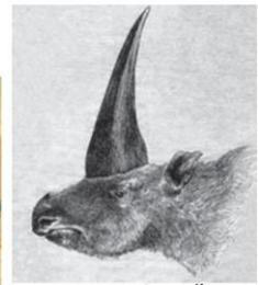
ภาพวาดยูนิคอร์นแห่งไซบีเรีย โดยราเชฟสกี (Rashevsky) ปี 1875

ว่าแม้จะดูดีและชัดเจนน้อยกว่าโครงกระดูกจำลองของออตโต แต่ก็ยังมีหลายจุดที่ยังดูผิดๆ เทียนๆ และที่สำคัญ นอกจากส่วนหัวที่มีเข่าแล้ว ไม่ว่างจะมองยังไง ซากฟอสซิลของยูนิคอร์นแห่งแม็กเดบอร์ก ก็ไม่ได้มีส่วนไหนเลยที่จะละม้ายคล้ายคลึงกับ "ยูนิคอร์น" ม้าเขาเขาเดียวในจินตนาการเลยแม้แต่น้อย แต่ในเวลานี้ เรารู้แล้วว่าสาเหตุที่โครงกระดูกของยูนิคอร์นแห่งแม็กเดบอร์ก นั้นมันออกมาไม่เหมือนม้าแต่ได้ขนาดนั้น ก็เป็นเพราะว่าซากที่ได้นั้นมาจากสุสานซากสัตว์ดึกดำบรรพ์และตัวการที่สำคัญที่อยู่เบื้องหลังซากเหล่านั้นก็คือ มนุษย์ "นีแอนเดอร์ทัล"