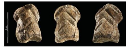
ภาพกระดูกสัตว์รูปลูกศรที่มีเนื้อเอ็นแอนเดอร์ธิลจากถ้ำยูนิคอร์น

แต่นั้นก็ไม่ได้หมายความว่าทุกคนจะเชื่อเหมือนกันหมด เพราะพอได้ยินชื่อถ้ำยูนิคอร์น รูดอล์ฟ เวอร์ชอว์ (Rudolf Virchow) แพทย์และนักชีววิทยาชื่อดังหนึ่งในผู้ก่อตั้งทฤษฎีเซลล์ร่วมกับบีโอดอร์ ชวานน์ (Theodor Schwann) และเมตเทียส ชไลเดน (Matthias Schleiden) ก็ตื่นเต้นมาก แต่เขากลับไม่เชื่อเรื่องราวของถ้ำแห่งยูนิคอร์นเลยแม้แต่น้อย และตัดสินใจมาตรวจสอบอย่างละเอียดด้วยตัวเองในปี 1872