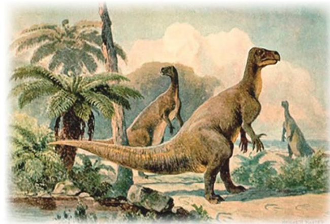
ภาพวาดไดโนเสาร์อิกัวโนดอนโดยศิลปินไฮน์ริช ฮาร์ดอร์ (Heinrich Harder) ในราวๆ ปี 1916

Newton) กลับดูวิจิตรพิสดารราวกับเป็นสัตว์จากโลกหิมพานต์ มีหัวเหมือนม้า มีขาเหมือนช้าง มี