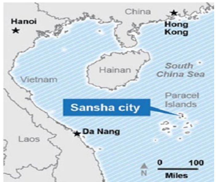
แผนที่หมู่เกาะซานซา (เมืองใหม่ของจีน)

แต่น้ำจืด อาหาร และยารักษาโรคต้องขนส่งมาจากแผ่นดินใหญ่เป็นประจำ ซึ่งในอนาคตอันใกล้มีแผนที่จะติดตั้งเครื่องกรองน้ำทะเล และเมื่อวันที่ ๒๓ พ.ย.๕๕ จีนได้พิมพ์แผนที่เมืองซานซาที่ครอบคลุมไปถึงหมู่เกาะสแปรตลีย์ หมู่เกาะพาราเซล เขตเศรษฐกิจจำเพาะและไหล่ทวีปของเวียดนาม