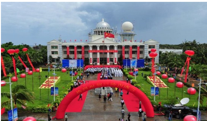
พิธีฉลองการสถาปนาเมืองซานซาของจีน ณ เกาะยงชิง

ชญญาทิพย์ ศรีพนา, การก่อตั้งเมืองซานซา (Sansha) บนเกาะยงชิง (Yongxing) หรือ เกาะวู้ดดี (Woody Island) ในทะเลจีนใต้, http://www.thaiworld.org/th/thailand_monitor/answer.php?question_id=1234