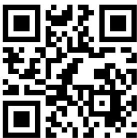
ประกาศมหาวิทยาลัยมหิดล เรื่อง แนวทางการปฏิบัติงานในพื้นที่ มหาวิทยาลัยมหิดลภายหลังเทศกาลปีใหม่