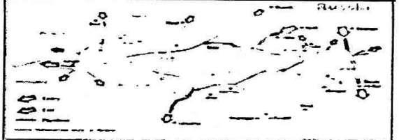
แผนภาพแสดงฐานทัพเรือรัสเซียซึ่งตั้งอยู่ในไครเมีย